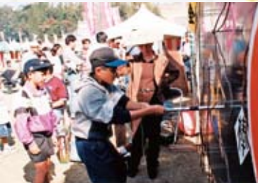
イライラしてます…。