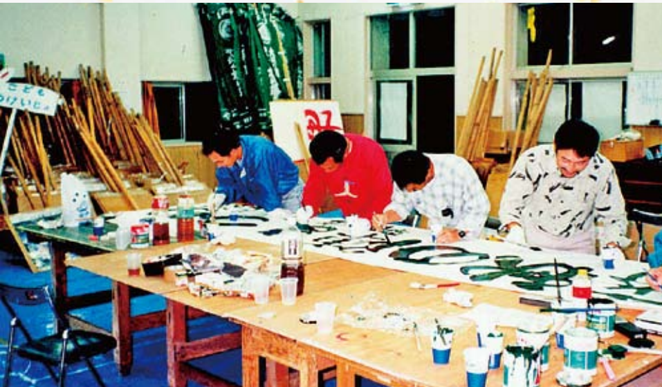
農業青年部による看板製作