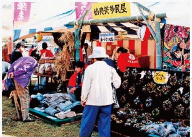
始良より応援販売