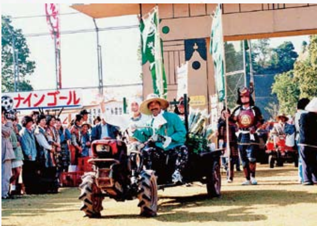
オラ東京さ行くだ (野菜の大盤振る舞い)