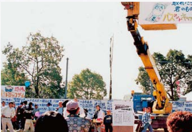
バスアンドキャッチで賞品ゲット!