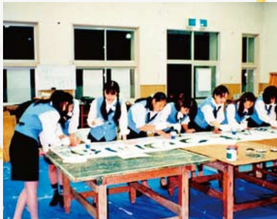
JA 女性陣による看板製作