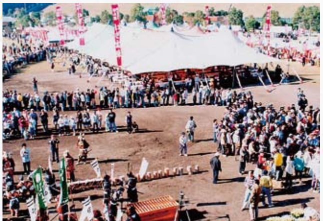
大盤振る舞いに長蛇の列!