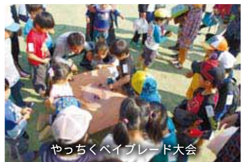
やっちくバドミントン大会